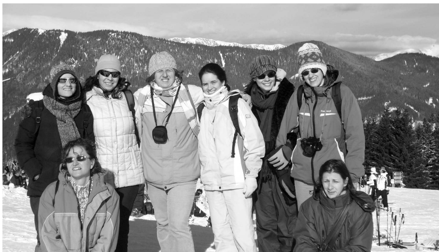
A CSAPAT EGY RÉSZÉ...

Visszafelé lemaradtam a kis csapatomtól, ezért rövidíteni akartam egy szűk erdei ösvényen, egyedül. A „természeti” csapás iránya jónak tűnt. Páratlanul vonzó, kalandra csábító volt. Összehajló fenyők, csend és nyugalom. Élőlény sehol. Ez volt a legszebb pár pillanat. Szerettem volna megosztani a többiekkel, de éreztem, hogy távolodom tőlük. Megpróbáltam az erdőn átvágni. Első lépéssel combig süppedtem a hóba. Nem volt könnyű kihúzni a lábam, de nem estem pánikba. Végiggondoltam, hogy biztonságban vagyok, várni fognak rám. Különcségem miatt megszégyenülve, de egy szép él-