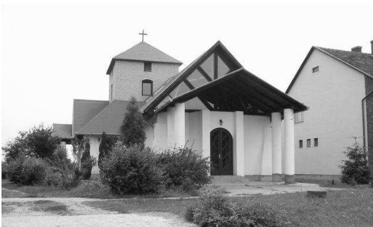
A HETESI METHODISTA KÁPOLNA

Kéthavonta a somogyfajsi öregek otthonában szolgálunk énekkel, Igével. Szintén minden második hónapban az ifi tagjai szervezik a hetesi játszóházat is. A nyári szünidőben a sok tábor miatt nem tartunk ifiórákat, de 2008 nyarán így is együtt töltöttünk egy hosszú hétvégét a Balatonon, amit szeretnénk hagyománnyá tenni.