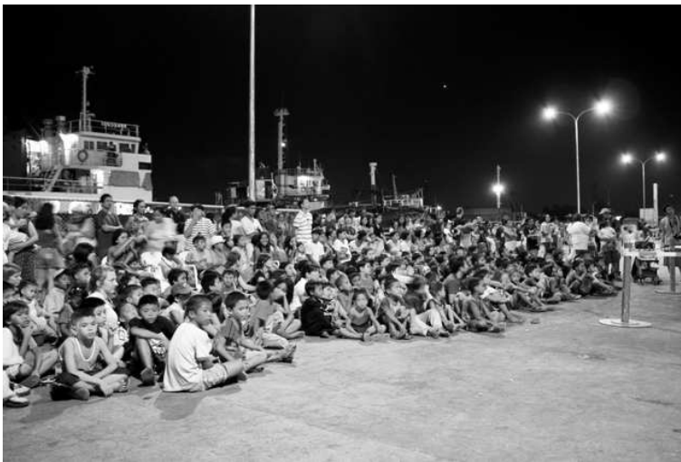
ESTI GYEREKPROGRAM A HAJÓ ELŐTT

Nos, ezek után még egy hetet az „iskolapadban” töltöttünk, mert a tanfolyam második hete a biztonsági képzés volt (tűz, veszélyhelyzet, jelek a hajón, elsősegélynyújtás, stb.) Pénteken volt a gyakorlati képzés: medencében mindenféle gyakorlat (életem második ugrása vízbe - emlékszel talán, hogy nem úszom, ezért ehhez nekem nagy bátorság kellett. Ettől nagyobb csak ahhoz kell, hogy itt legyek a