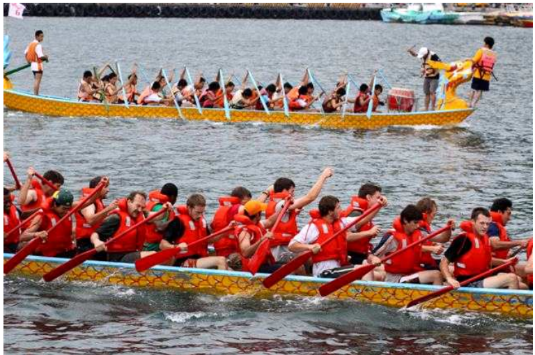
VERSENYBEN A DOULOS EVEZŐCSAPATA (ELŐTÉRBE)